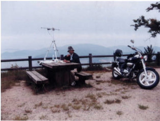
山口県玖珂郡由宇町銭壺山(540mH)より ハンディ機QRP・FMで500km交信ができるとは思いませんでした。6メートルでも、広島自宅からハンディ機・QRPで北海道から沖縄まで交信します。 de JJ4MEA/4

たまたま家族が留守で時間つぶしにRIGのSWを入れたらコンテストをやっていました。というわけで、初めての参加です。