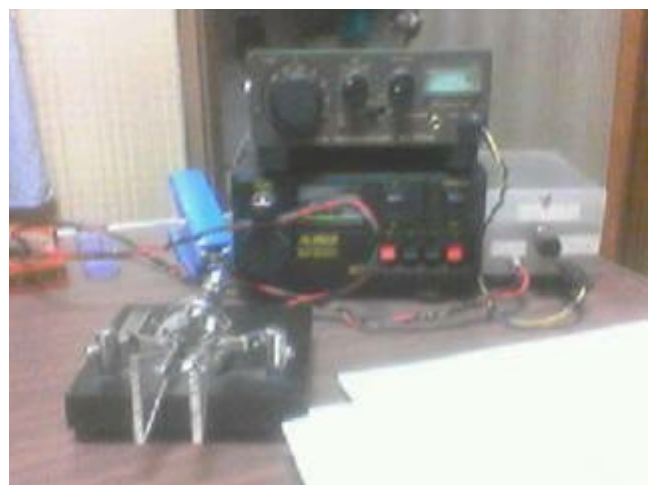
QRPのため、少得点でした de JA7IDE