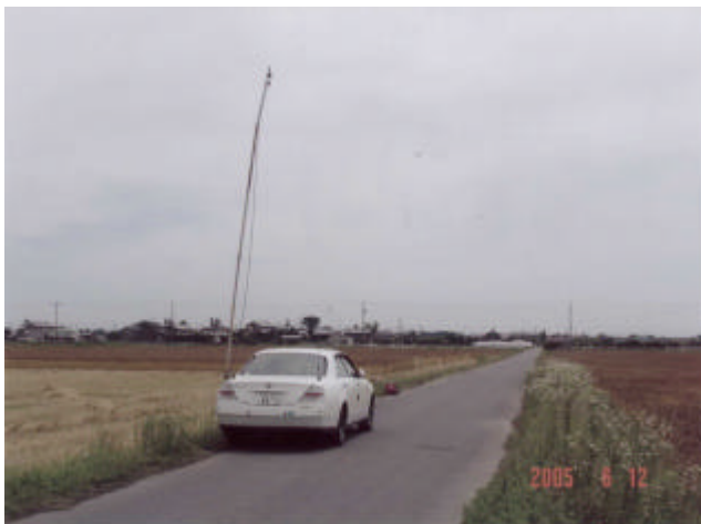
運用場所は一面の麦畑です