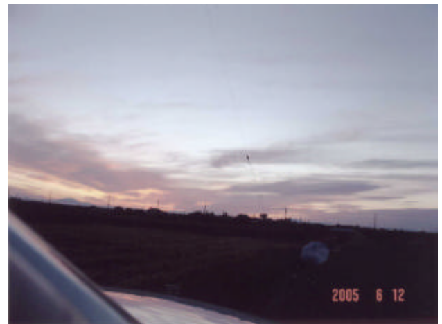
朝4時半に朝焼けで目覚めました