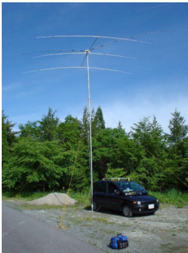
中津川市・二ツ森山から参加しました