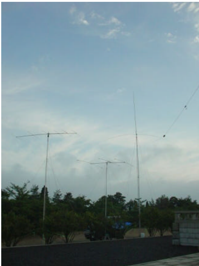
左から50MHz6エレ、21/28MHz3エレ。右端は上から144-1200MHzGP・14MHzRDP・1.9/3.5MHzIV・7MHzIV。V/UHFのGPはよく飛び、430CWで1エリアと複数QSOできました

JK1SDQ コンテストのe-mailによるご案内感謝。危うく忘れるところでした。昨年並みの実績しかあがらなかったのが残念。<編：こういう声を聞くと、来年も案内を送らなくちゃ、ってなりますね。今年のX-S1.9はレコードが塗り替えられましたから、来年はより一層熾烈な争いになるかも？>