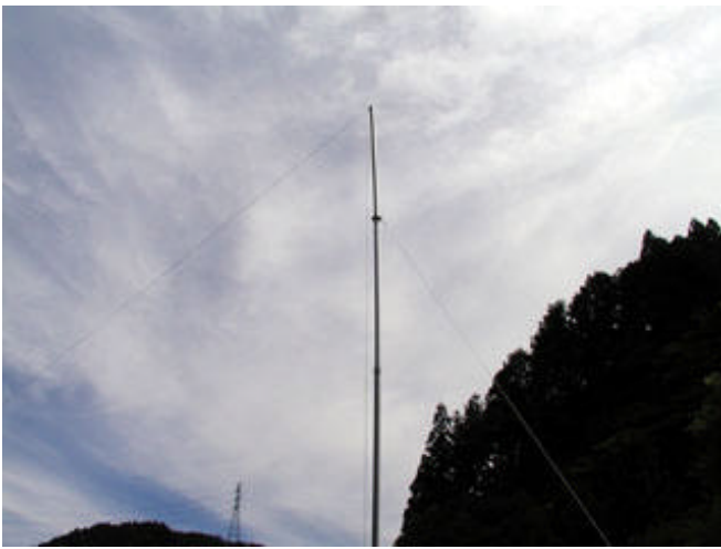
アンテナはAH4と40mLワイヤーを使用しています de JP2GUL/2

JL1VWL 楽しめました。部門がたくさんあり、集計は大変でしょうが、たくさんの方が入賞のチャンスがあり、良いと思います。<編：ありがとうございます。電信部門は「もっと多くの種目を」と言われていますが、オール岐阜の規模ではこのぐらいが適当かとhi>