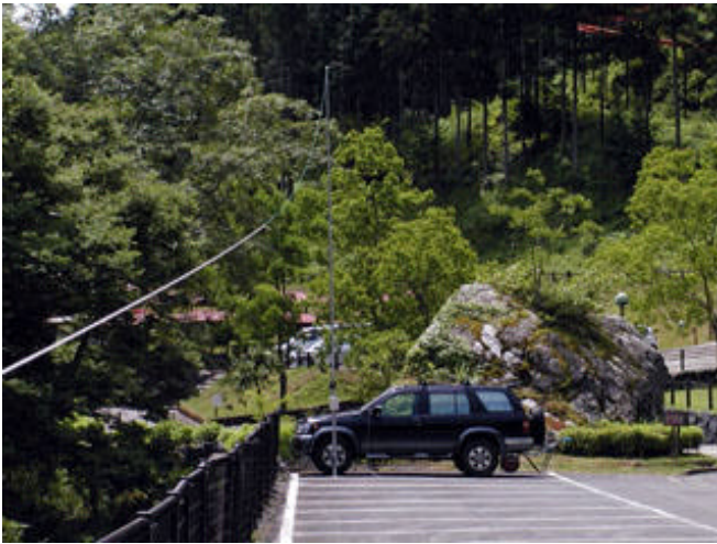
家族サービスを兼ねて山県市のキャンプ場から参加しました