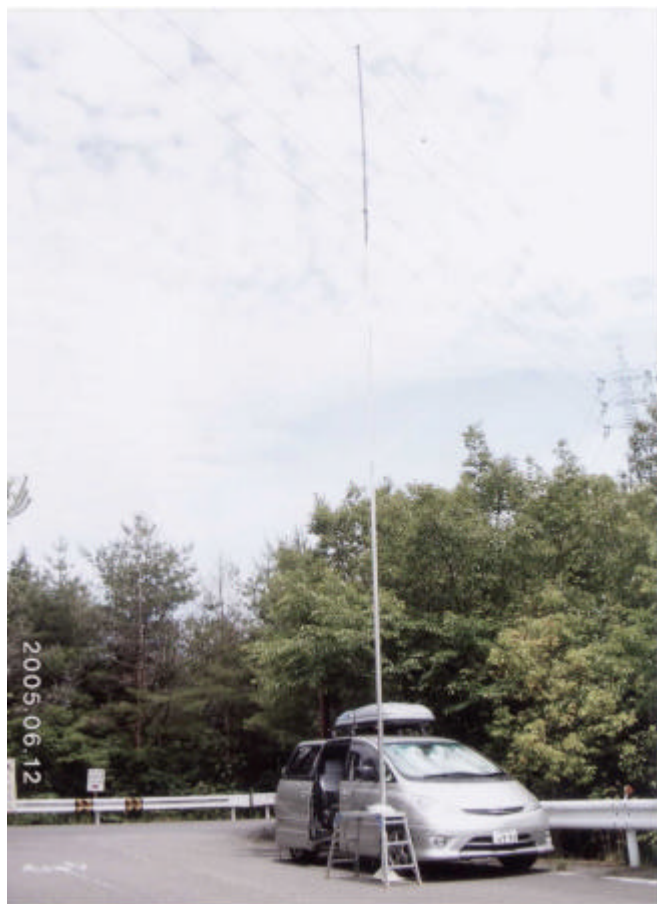
上：自作変形ループAnt 右上：当日のシャックの様 懐かしいRigが見えますね