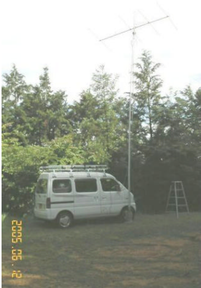
コンテストの時の写真です。 地面が軟弱で、ローバンドのIVを引きすぎて、傾いてしまいました。